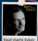
Ravel chante Dubois