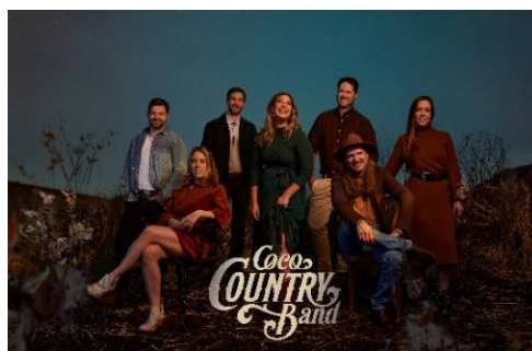
Coco Country Band Dimanche 18 mai 20 h