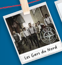
Les Gars du Nord