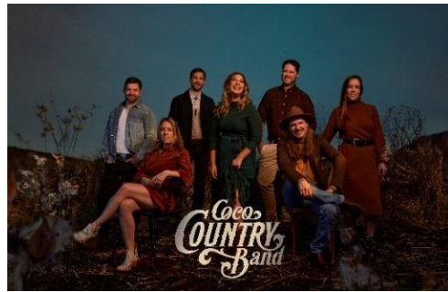
Coco Country Band Dimanche 18 mai 20 h