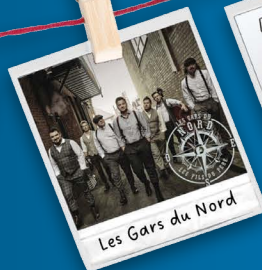
Les Gars du Nord